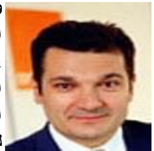
ديديير كيويت Didier Quillot

وقدم "ديديير كيويت - Didier Quillot" الرئيس التنفيذي لمؤسسة " لاغردير أكتيف الإعلامية - LagardèreActive Media"، وهي من أكبر دور